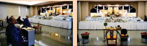
〈令和2年度の灯籠会の様子〉